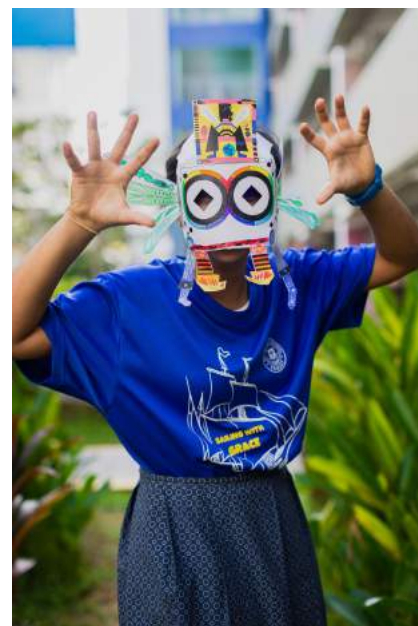
Atelier Masques Augmentés, dans le cadre du Festival Arts in Your Neighbourhood - Novembre 2021